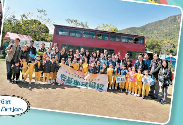
低班 親子 ArtJam