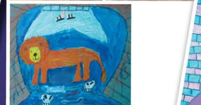
原來獅子媽媽正在生獅子BB呢！因為當時繪畫這幅畫的孩子的媽媽將會誕下一個弟弟給他！