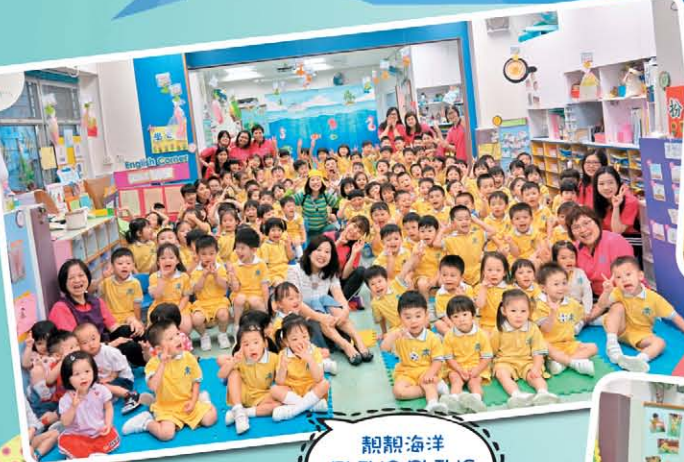
親親海洋 BLING BLING BLING 劇場