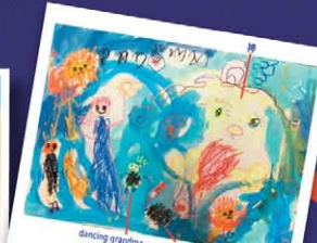
這一幅是但以理在獅子坑和一家獅子的圖像，看看獅子媽媽在後腳和尾巴間多了兩隻腳，你想這是什麼呢？