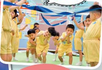
低班設計 活動一水