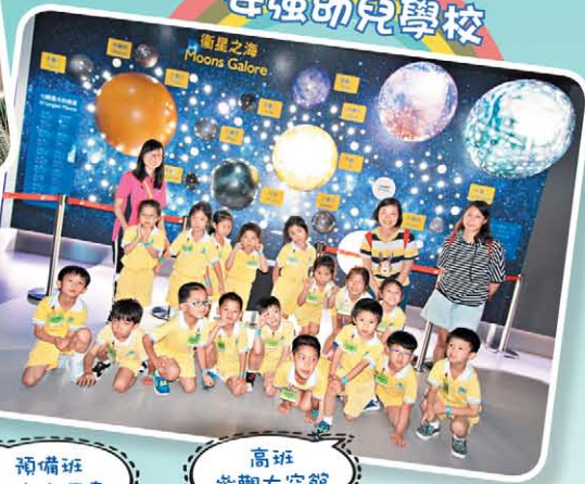
預備班 的士大探索