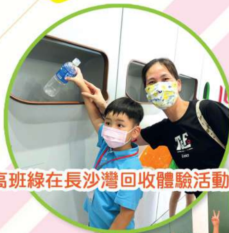
高班綠在長沙灣回收體驗活動