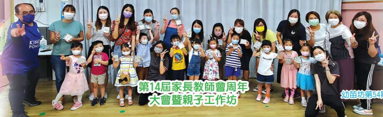
第14屆家長教師會周年 大會暨親子工作坊