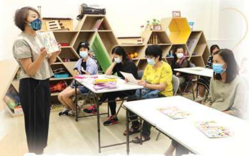
「童您玩一齊見面一齊玩」 家長學堂