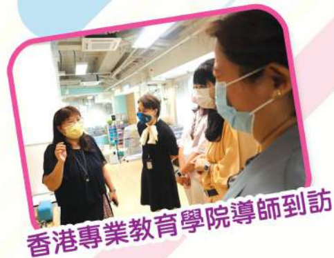
香港專業教育學院導師到訪