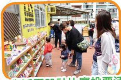
親子復活蛋設計比賽投票活動