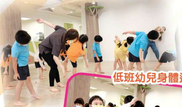
低班幼兒身體遊樂場