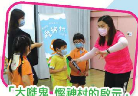
「大喉鬼_慳神村的啟示」 故事劇場