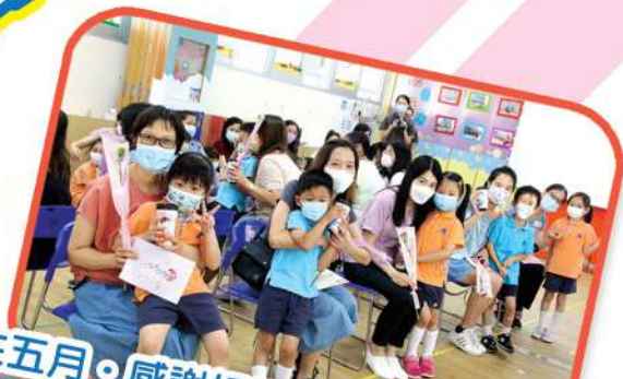
「愛在五月·感謝媽媽」 母親節活動