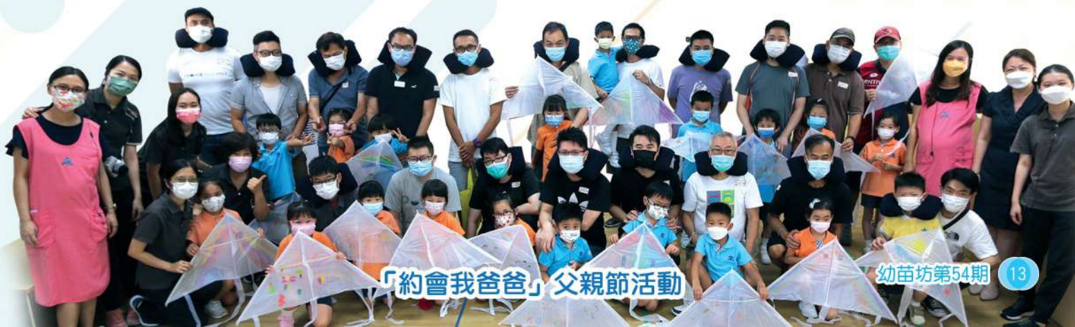
「約會我爸爸」 父親節活動