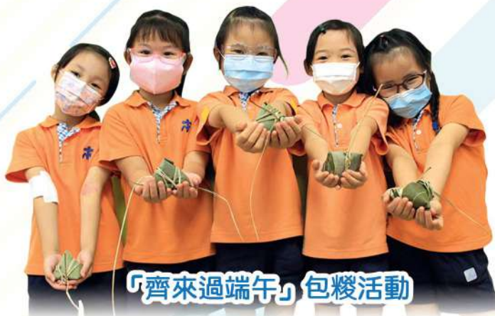
「齊來過端午」 包糉活動