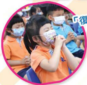
「復活真理我要知」 復活節活動