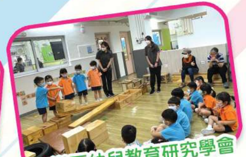
太平洋區幼兒教育研究學會 (香港分會) 團隊到訪