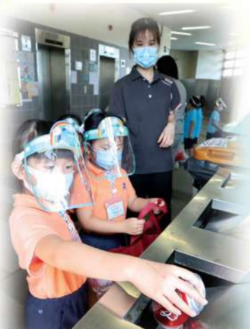
「認識回收箱」低班主題活動