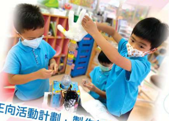
「正向活動計劃」製作無障礙設施