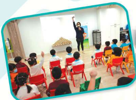
「大咗鬼-慳神村的啟示」故事劇場