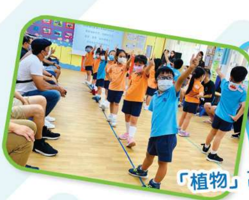
「植物」 高班設計活動