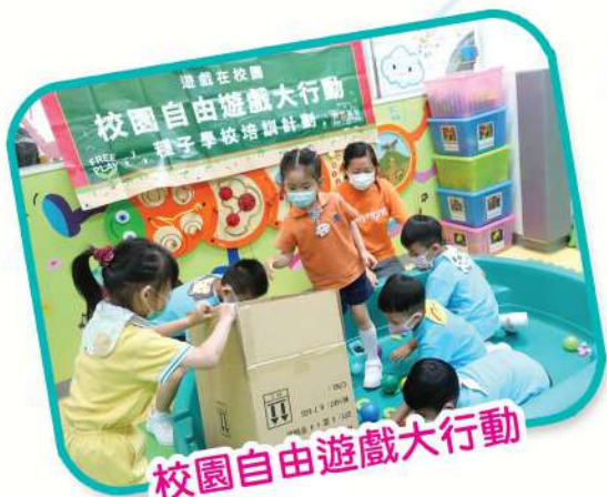
校園自由遊戲大行動