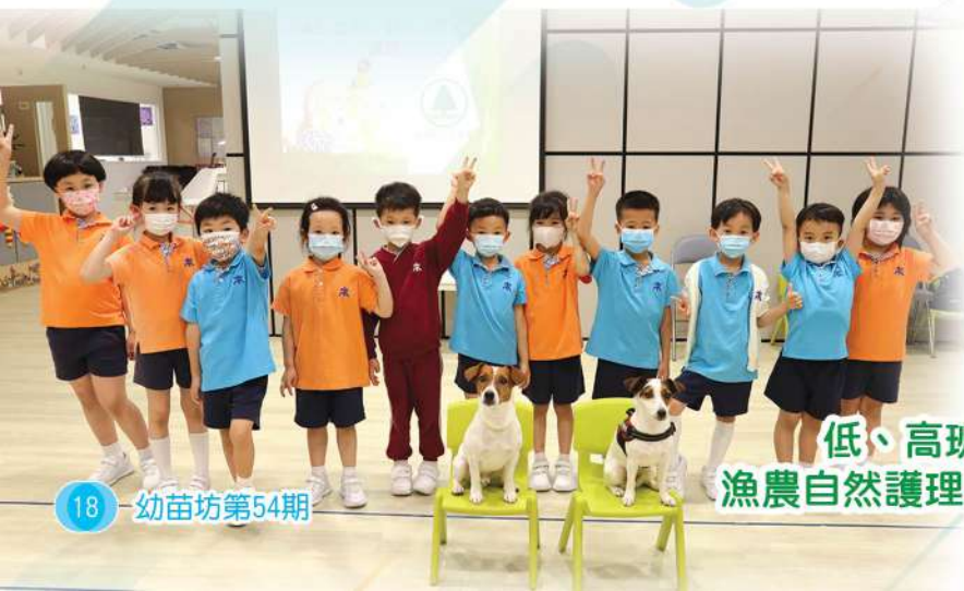
低、高班 漁農自然護理處講座