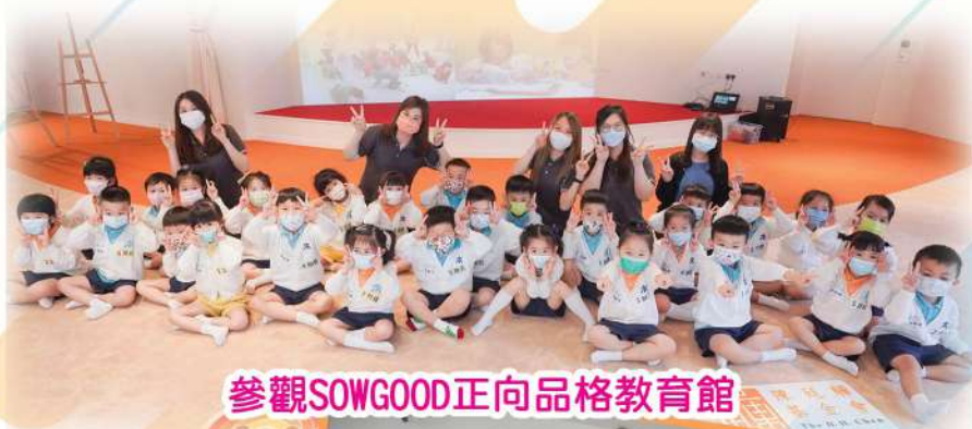
參觀SOWGOOD正向品格教育館