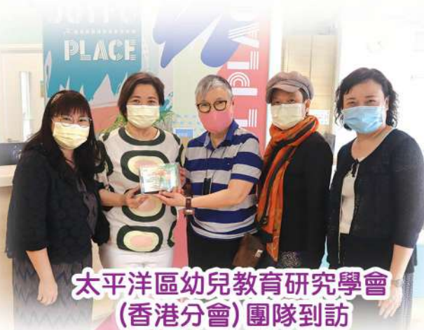
太平洋區幼兒教育研究學會 (香港分會) 團隊到訪