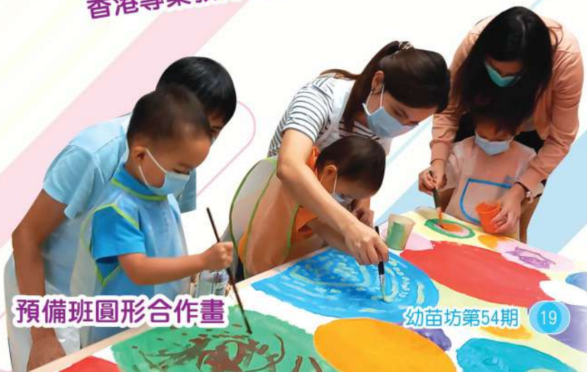
預備班圓形合作畫