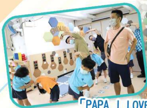
「PAPA I LOVE YOU」父親節活動