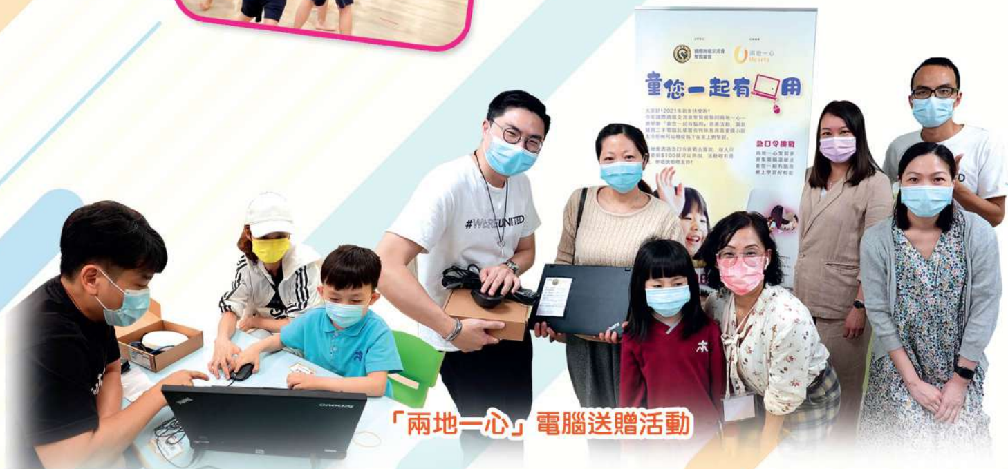
「兩地一心」電腦送贈活動