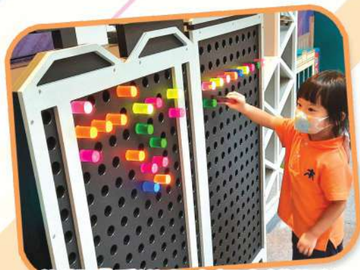
參觀「香港兒童探索博物館」