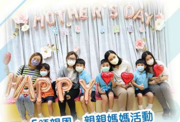
「頌親恩」親親媽媽活動