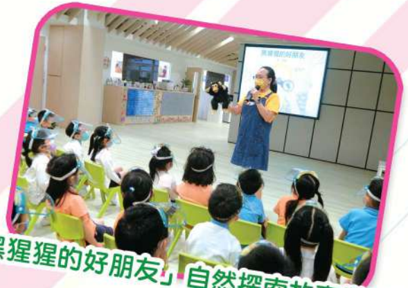
「黑猩猩的好朋友」自然探索故事樂園