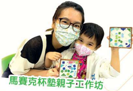
馬賽克杯墊親子工作坊