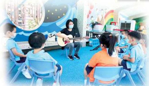
低班音樂治療遊戲小組