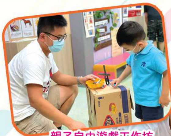
親子自由遊戲工作坊