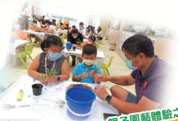
親子園藝體驗之旅