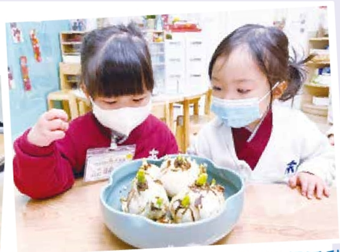
農曆新年慶祝活動