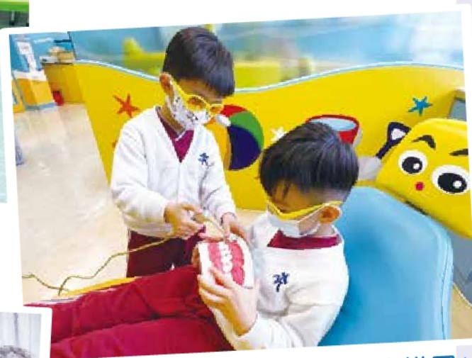
低班 - 參觀「陽光笑容小樂園」