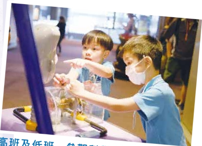
高班及低班 - 參觀科學館