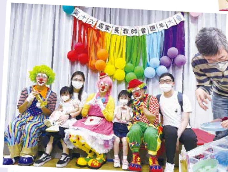
第 16 屆家長教師會周年大會