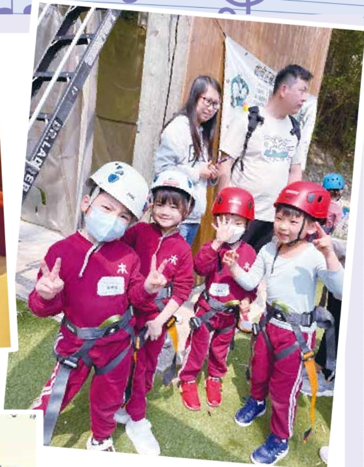
高班 - 家教會旅行