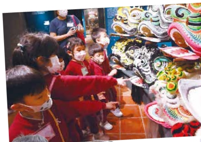
高班 - 參觀非遺大本營