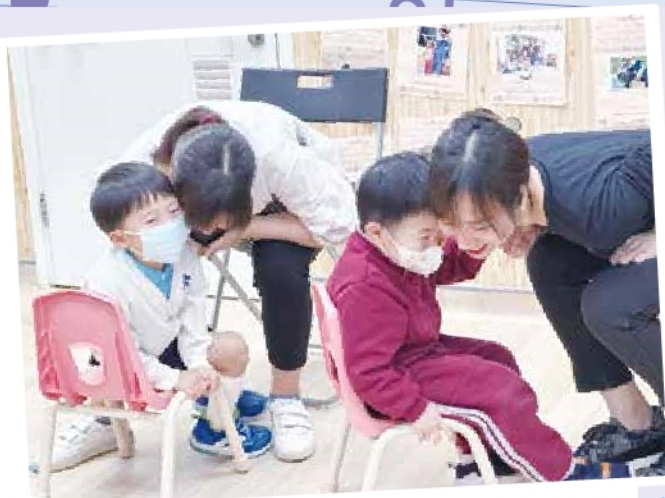
玩樂親子情工作坊