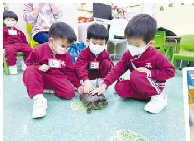
預備班 - 主題活動「觀察小烏龜」