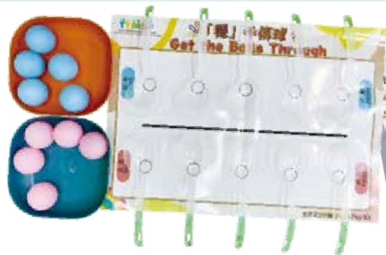
「穩」手傳球，訓練專注力和手眼協調