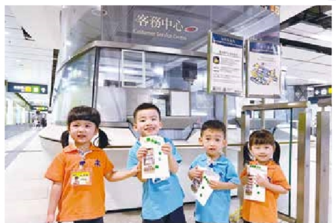
預備班 - 參觀港鐵站