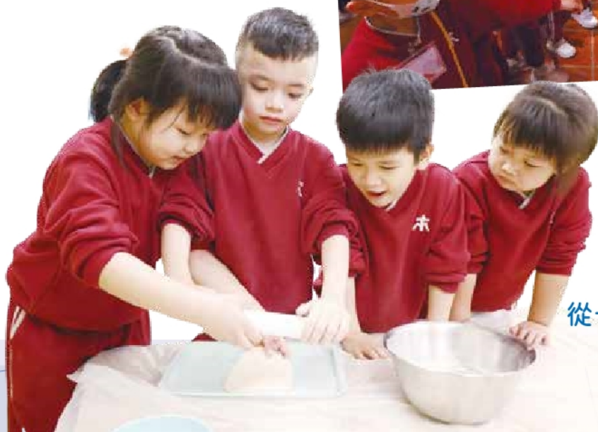
復活節活動 從十字架來的恩典