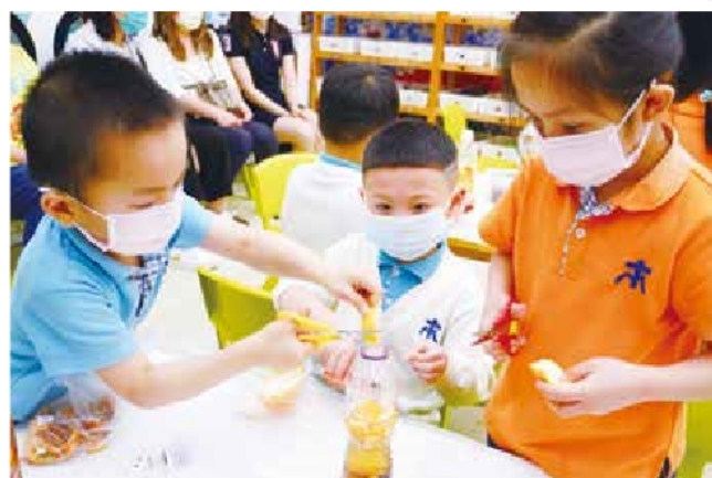
低班 - 製作廚餘酵素清潔劑