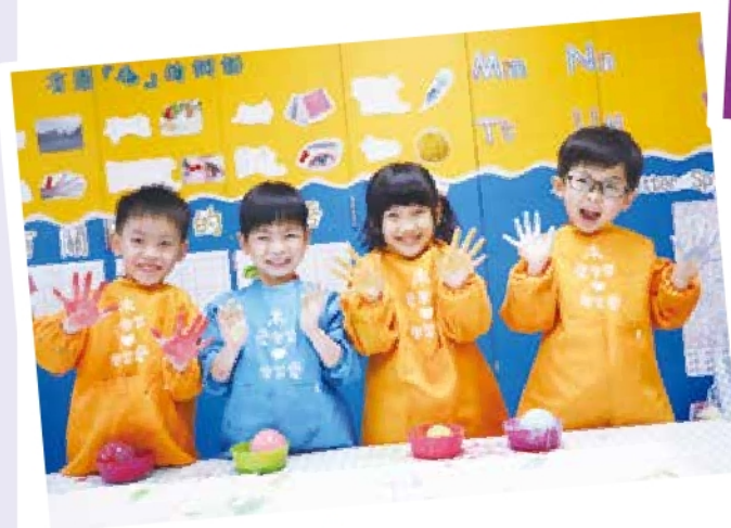
3 月份 Art Fun Day