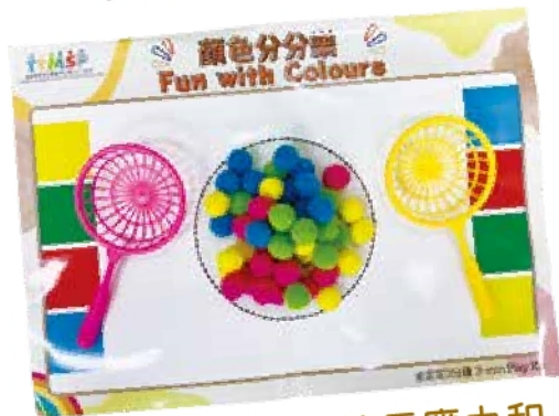
顏色分分樂，訓練反應力和對顏色的認知能力

學校社工服務把遊戲盒送贈予學校及家長，學校及家長們對遊戲盒的反應正面，他們認為遊戲盒簡單有趣，並附上淺白的中英文遊戲說明和示範影片，有助他們掌握遊戲的玩法，部分家長甚至自創了新的玩法。