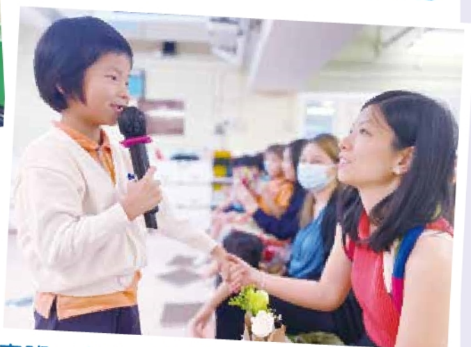
高班 - 童來讚媽媽