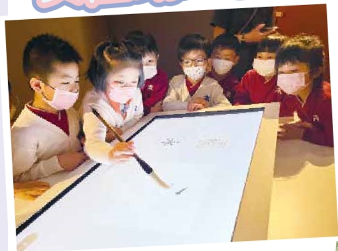
高班 - 參觀故宮博物館