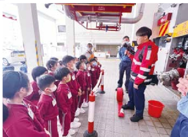
高班 - 參觀消防局