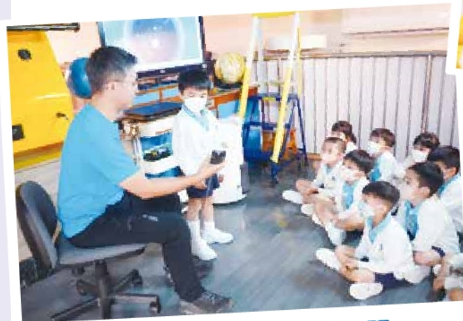
高班 - 參觀可觀自然教育中心暨天文館