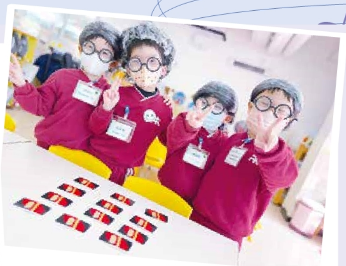
低班 - 做個老友記