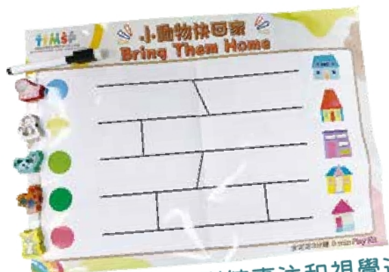
送小動物回家，訓練專注和視覺追蹤能力

理想的親子共處除了有助於幼兒發展正向的情緒，長遠能讓幼兒建立自尊和自信。而親子遊戲更讓家長能夠以輕鬆的方法培養幼兒解決問題的技巧和情緒控制能力等。我們鼓勵家長在家中多進行親子遊戲，且不必過於拘泥於遊戲規則，反之全情投入其中，共享親子樂趣。如果家長想要掌握更多成為子女玩伴的技巧，歡迎掃描下面的二維碼，瀏覽更多資訊。