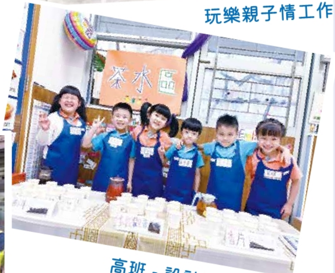
高班 - 設計活動展示會