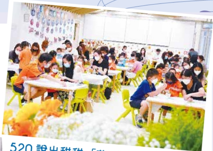
520 說出甜甜「花」語 - 親子工作坊