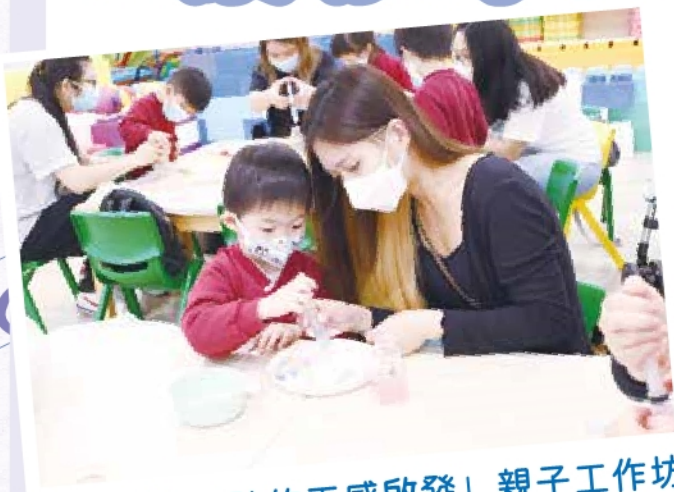
童亮「小小孩的五感啟發」親子工作坊