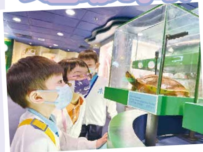
低班 - 參觀瀕危物種資源中心